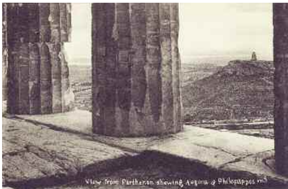
Η Αίγινα και ο λόφος Φιλοπάππου από τον Παρθενώνα.