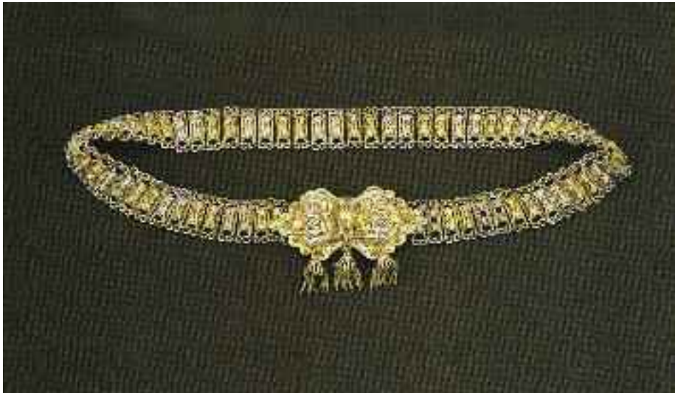
Καλαρρυτιώτικη ζώνη παραδοσιακής τεχνικής.

Ο χώρος στον οποίο θα διαπρέψουν μετά το 1821 οι ξεριζωμένοι αυτοί Ηπειρώτες είναι τα Επτάνησα. Οι περισσότερες από τις οικογένειες των καλαρρυτινών ασημουργών, θα καταφύγουν κυρίως στη Ζάκυνθο, ενώ μερικές οικογένειες θα μετοικήσουν και στην Κέρκυρα.