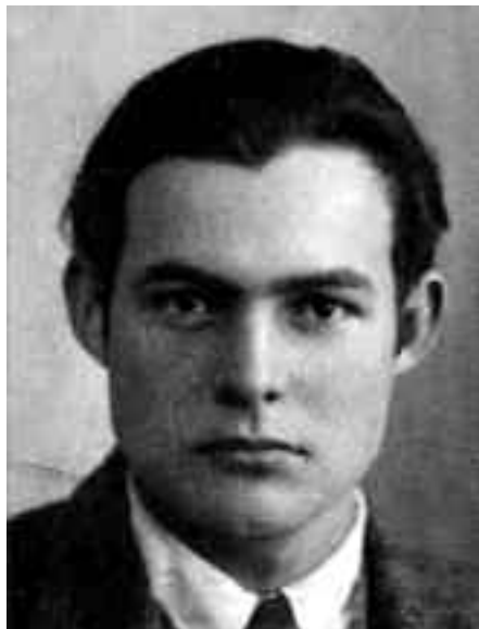
Ο Έρνεστ Χέμινγουεϊ το 1923.

«Το χειρότερο, είπε, ήταν οι γυναίκες με τα νεκρά παιδιά. Δε μπορούσαμε να τις πείσουμε να μας δώσουν τα πεθαμένα παιδιά τους. Είχαν τα παιδιά τους, νεκρά ακόμα και έξι μέρες, αλλά δεν τα εγκατέλειπαν. Δε μπορούσαμε να κάνουμε τίποτα. Τελικά έπρεπε να τους τα πάρουμε με τη βία.» (Από τη συλλογή διηγημάτων του με το γενικό τίτλο «Στην προκυμαία της Σμύρνης»). Με τα παραπάνω λόγια κάποιος ήρωας του Χέμινγουεϊ, αξιωματούχος πολεμικού πλοίου των ΗΠΑ αγκυροβολημένου στη Σμύρνη, περιγράφει τη μεγάλη καταστροφή.