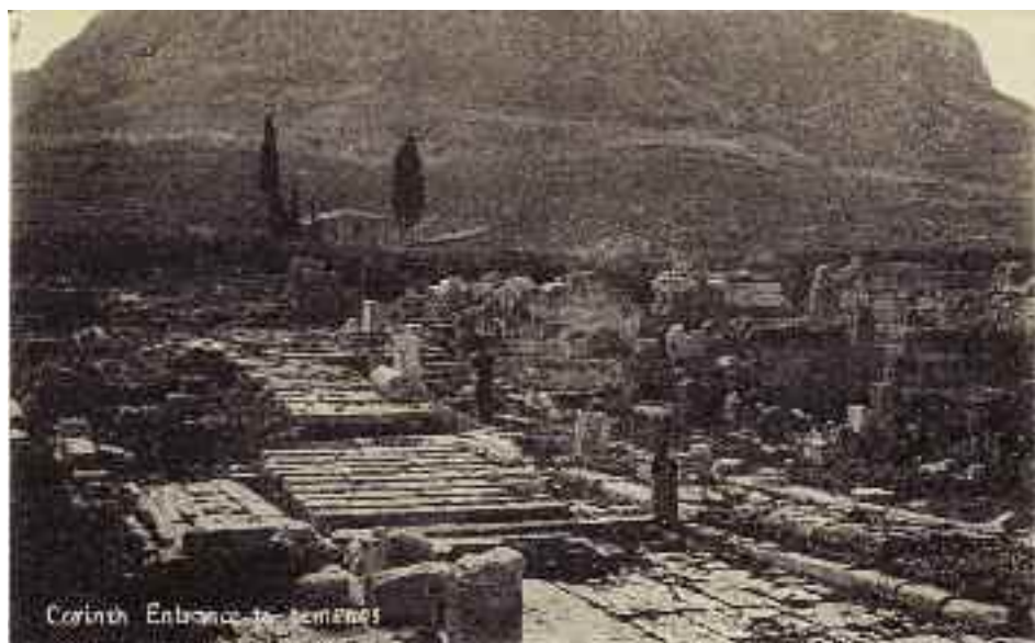
Κόρινθος: Είσοδος στο ναό.