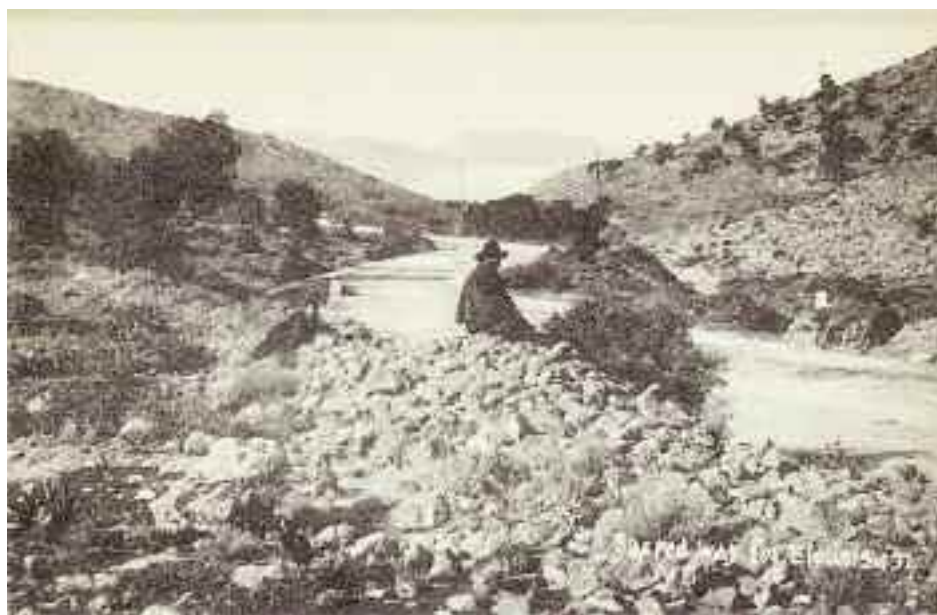
Η Ιερά Οδός προς την Ελευσίνα.