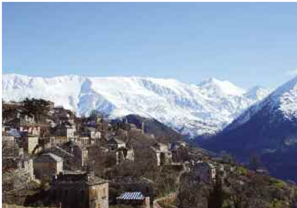
Μερική άποψη Καλαρρυτών