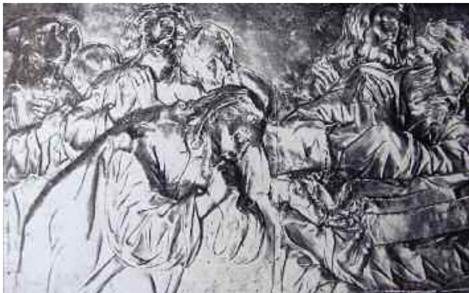
Λεπτομέρεια από τη Λάβνακα

Μπάφας δεν έφτασε τη φήμη του συμπατριώτη του. Ίσως έφταιξε σ' αυτό και το γεγονός ότι, καθώς φαίνεται, η δουλειά του Μπάφα δεν ξεπέρασε τα όρια της Επτανήσου.