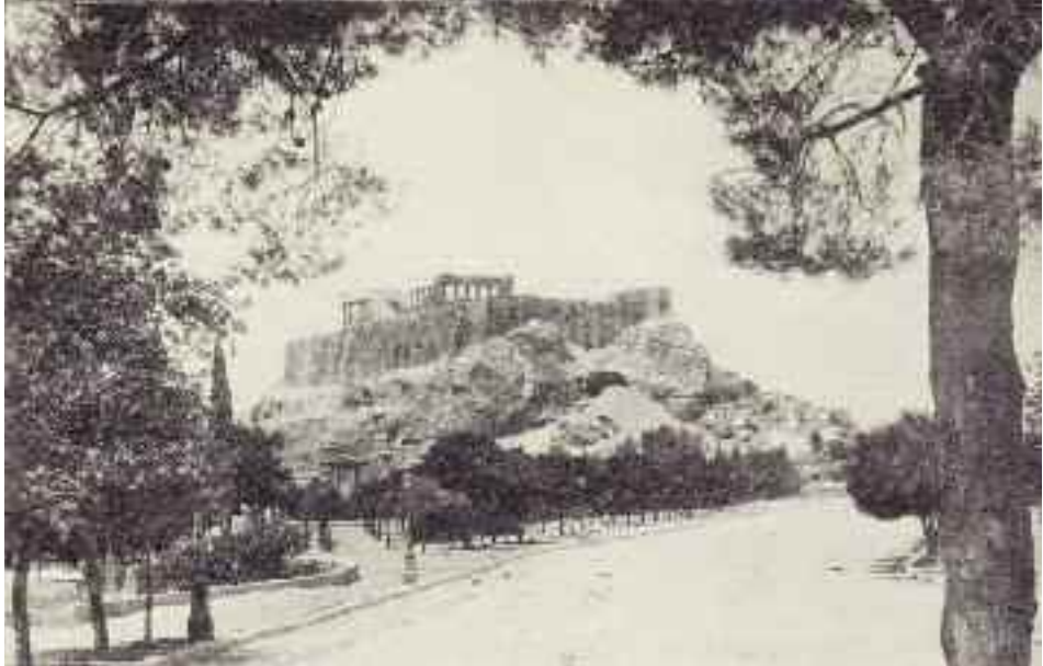
Καρτοστάλ της Ακρόπολης