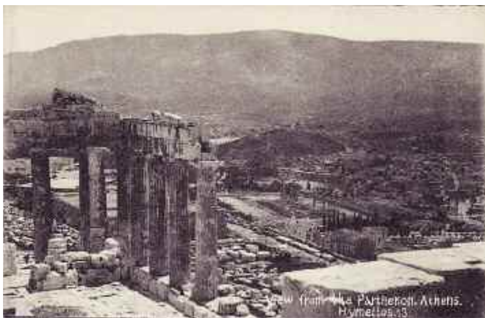
Θέα από τον Παρθενώνα. Υμηττός