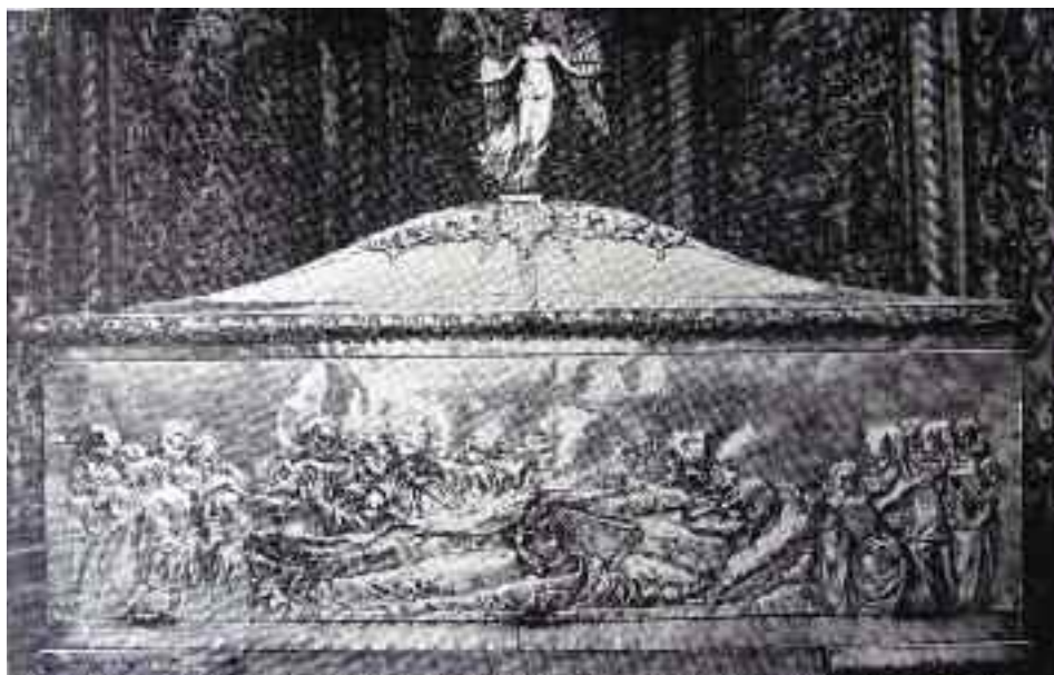
Ασημένια Λάρνακα Αγ. Διονυσίου Ζακύνθου, έργο Γ. Δ. Μπάφα.

θαύμα Ελληνικόν. Τί άλλο παρά θαύμα είναι διότι ένας άνθρωπος ζήσας εις τους Καλαρρύτας, υπό τον τρόμον του Αλή Πασά, ένας Ηπειρώτης αγράμματος, κατώρθωσε να υψώσει την καλλιτεχνικήν του αντίληψιν εις την κορυφήν της Διεθνότητος, εις την πλέον γενικήν έννοια της τέχνης και να φαίνεται εις τα αργυρόγλυφά του ως το απόσταγμα ενός μεγάλου πολιτισμού . . .».