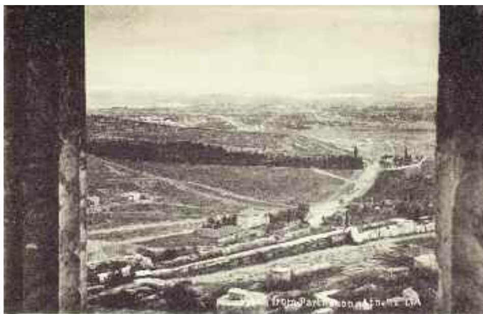
Θέα από τον Παρθενώνα.