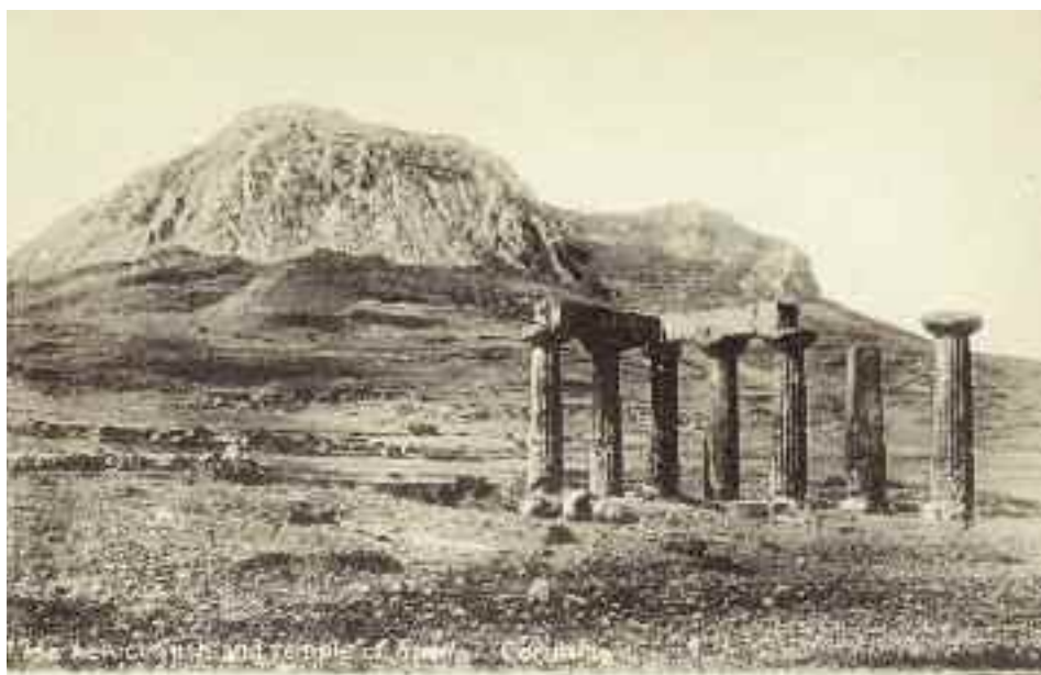
Ακροκόρινθος και ο ναός του Απόλλωνα.