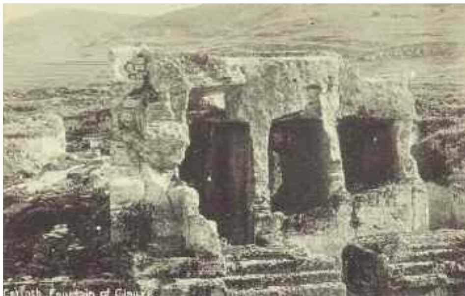
Κόρινθος: Η κρήνη Γλαύκη.